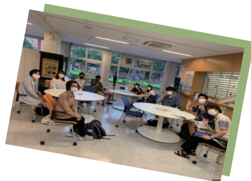
#初めてうーたす!の記事作ってみた #新人スタッフ作成記事

UU-PRASとは、 Utsunomiya University - Public Relatives Active Students の頭文字を略した 宇都宮大学企画広報課学生スタッフの事です。 活動内容としては「うーたす!」の発行を軸に、 オープンキャンパスや大学広報誌のお手伝いなど、 幅広く宇都宮大学の広報活動を行っています!